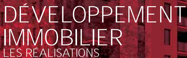
/ LA TANNERIE