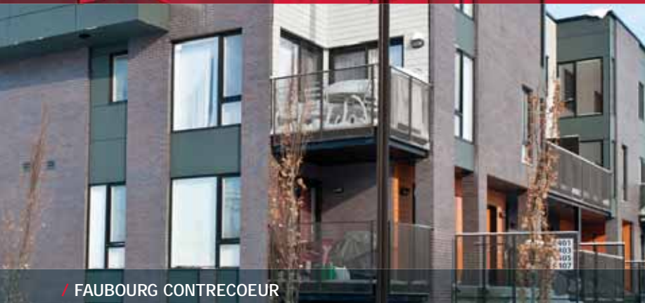
/ FAUBOURG CONTRECOEUR